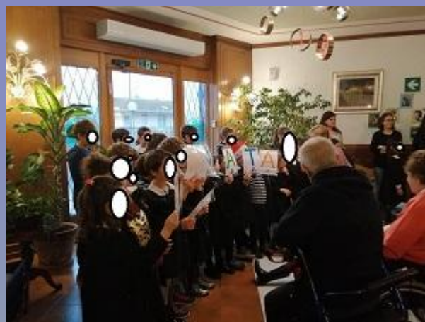
natale in villa san fermo