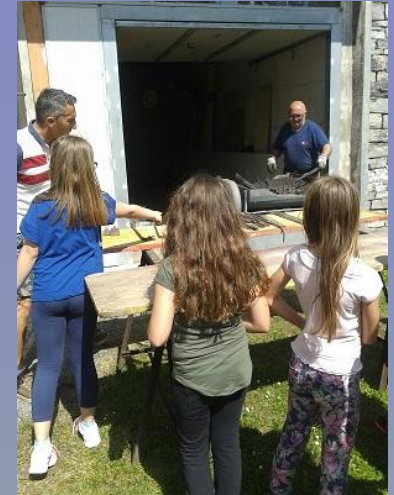
visita all'officina del fabbro