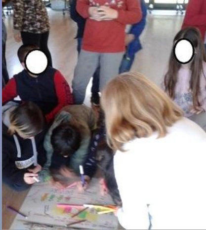
progetto costituzione con biblioteca