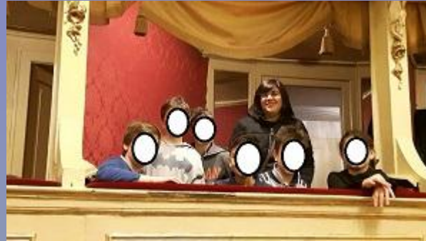
progetto "opera domani" teatro sociale