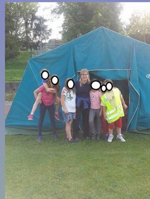
campo protezione civile