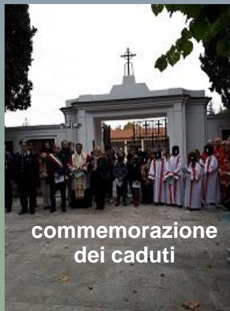
commemorazione dei caduti