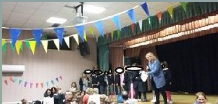
festa dei nonni