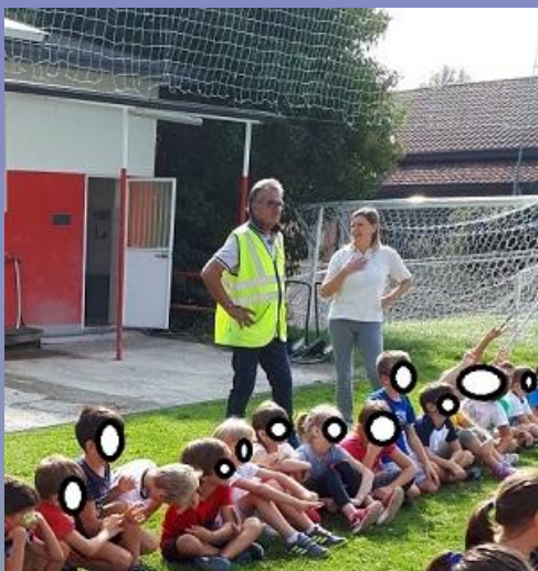
festa dello sport con il G.S. cavallasca