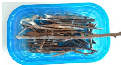
legnetti di spessore simile